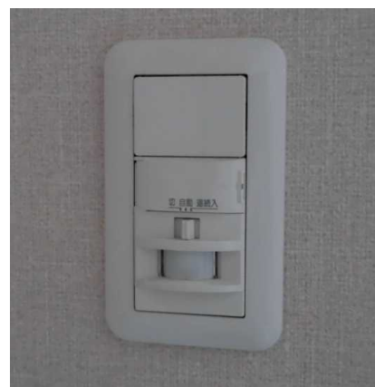
通路などでの照明用人感セン