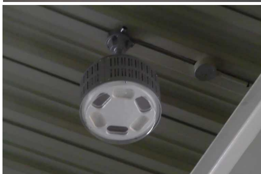
作業現場へのLED照明設置