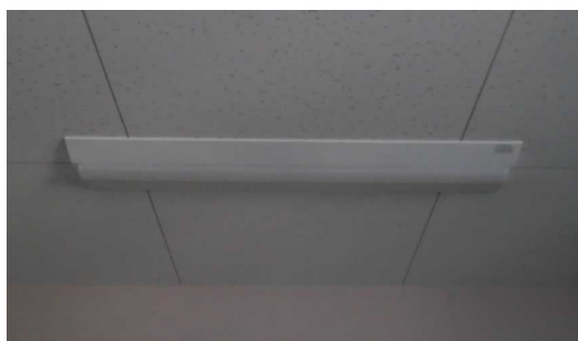
事務所及び通路でのLED照明設置