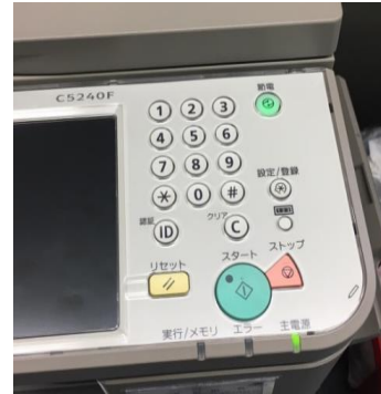
コピー機節電表示