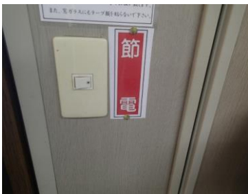
現場事務所のステッカー等掲示