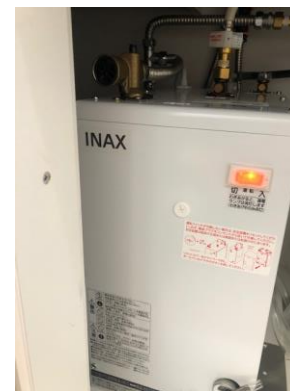
ガス給湯器から電気温水器へ変更