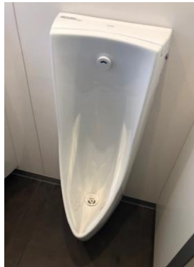
トイレ改修(節水型)