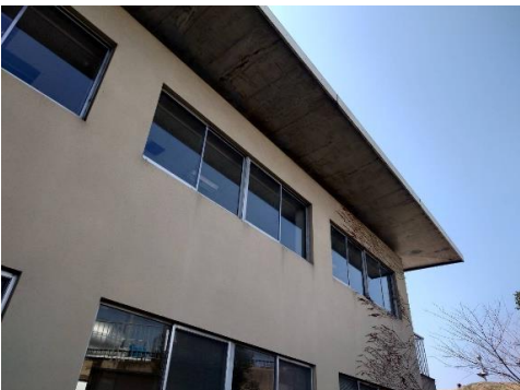
国立県営兵庫障害者職業能力開発校