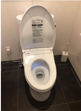
トイレ改修(節水型)