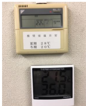
室内温度の社内啓発