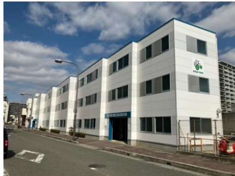
JR塚口駅西自転車駐車場改修工事