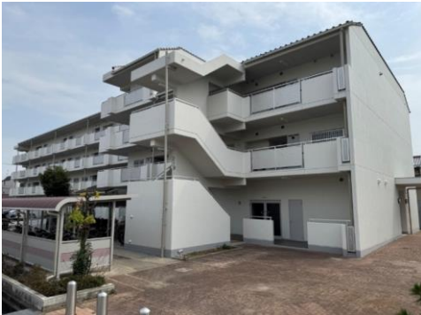
市営平松住宅外壁及び屋上防水改修工事