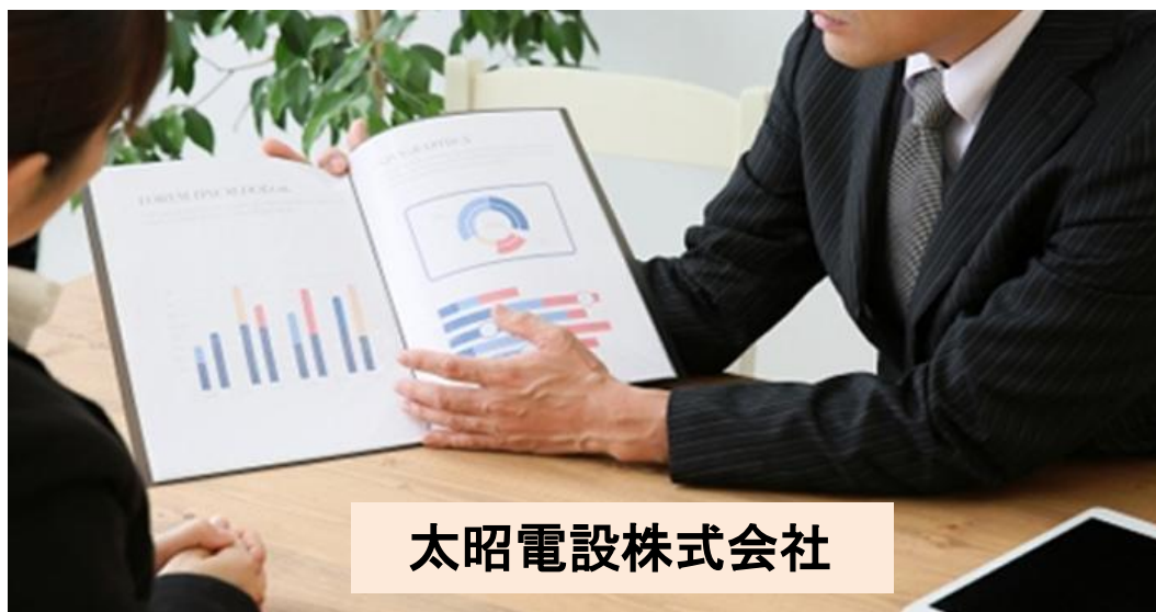
太昭電設株式会社

電気設備の設置がゴールではありません。 お客様のメリットを見据えて、 人間力と提案力を磨き続けます。