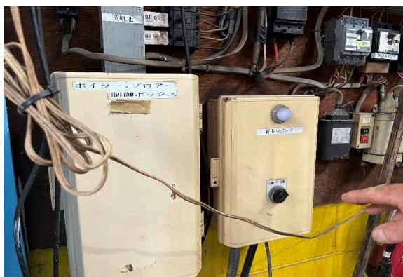
(緊急事態時の操作方法確認)