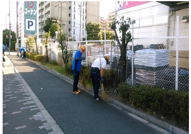
<清掃活動> ※就業前・後に毎日活動